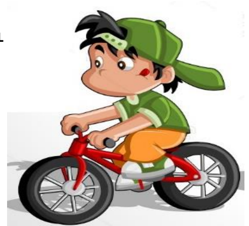
Foto 2 X 2